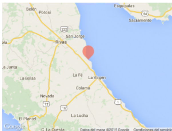
Ubicación de Obrajuelo

En las incursiones de los funcionarios de HKND, en compañía de efectivos de la Policía y el Ejército Nacional, más un representante de la Procuraduría General de la República, una camioneta del concesionario fue apedreada.