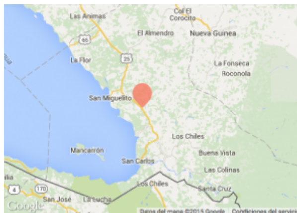
Ubicación de El Tule