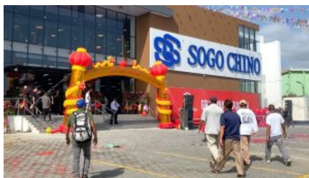
Le supermarché Sogo, situé près de l'Oriental, passe pour être le plus grand du Nicaragua

Les 15 concessions restantes se répartissent entre huit sociétés minières chinoises. Elles absorbent 171 546,13 hectares répartis principalement dans la Caraïbe nicaraguayenne.