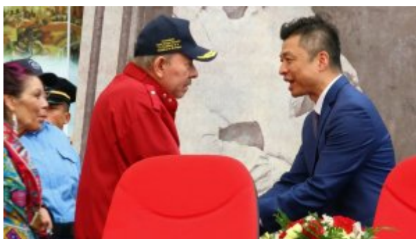
Daniel Ortega salue le nouvel ambassadeur de Chine au Nicaragua, Qu Yuhui, le 8 novembre 2025, à Managua

À l'inverse, l'accès au marché chinois demeure marginal pour les exportations nicaraguayennes. Malgré une augmentation de la part des exportations vers la Chine, le volume en valeur absolue reste réduit. Entre janvier et mai 2025, la Chine n'a représenté que 1,9% des destinations des exportations nicaraguayennes (69 millions de dollars), toujours très loin de marchés traditionnels comme les États-Unis (45,5%) et l'Amérique centrale (16,8%).